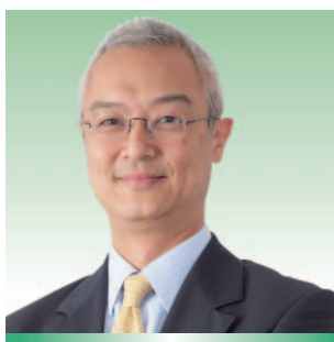
何沛謙先生 通訊事務管理局主席