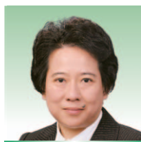
何淑兒女士, JP 通訊事務管理局副主席 商務及經濟發展局常任秘書長 (通訊及創意產業) 1